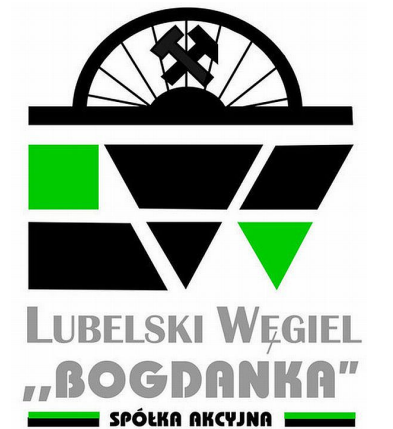
GK LW Bogdanka SA