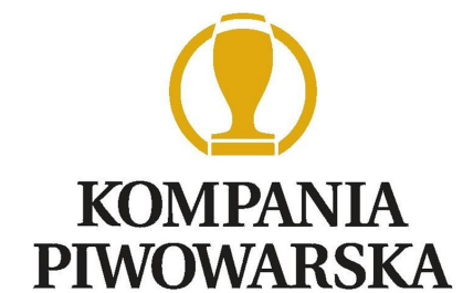
. Kompania Piwowarska