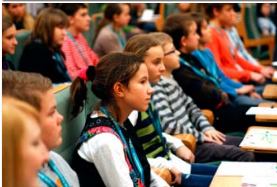
Zajęcia na Ekonomicznym Uniwersytecie Dziecięcym