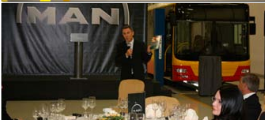
Spotkanie wyjazdowe członków Klubu Partnera UEP w firmie M.A.N. Bus Sp. z o.o.