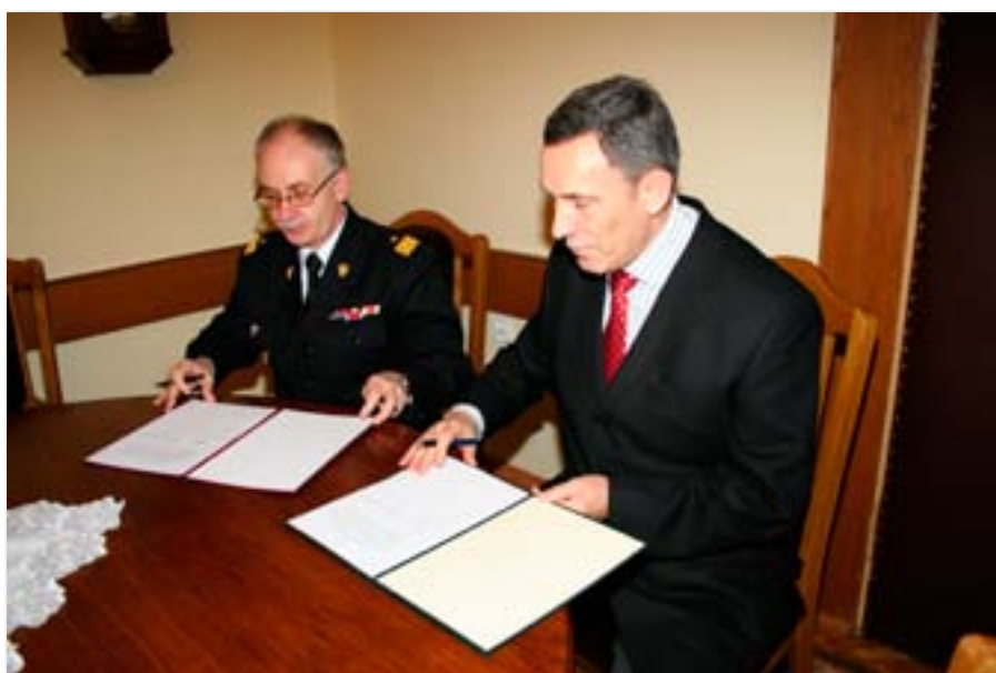
Podpisanie porozumienia z Komendą Wojewódzką Państwowej Straży Pożarnej w Poznaniu

i kontrolingu oraz public relations. Pełna oferta studiów podyplomowych na Uniwersytecie Ekonomicznym w Poznaniu dostępna jest na stronach internetowych Uczelni.