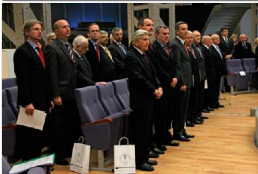
Spotkanie absolwentów Uniwersytetu Ekonomicznego w Poznaniu w dniu 9.10.2010 roku z okazji 80-lecia Stowarzyszenia Absolwentów UEP