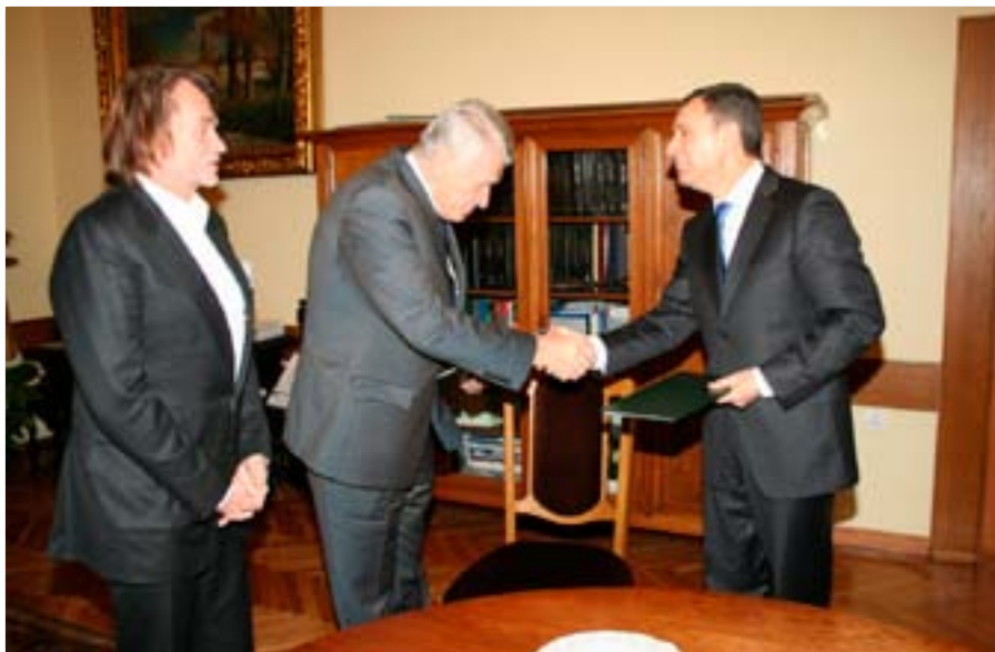
Porozumienie o współpracy pomiędzy Uniwersytetem Ekonomicznym w Poznaniu a Autostradą Wielkopolską S.A.

Bardzo wysoki poziom projektów badawczych realizowanych przez pracowników naukowych Uniwersytetu Ekonomicznego w Poznaniu został doceniony również przez jury III edycji konkursu Urzędu Miasta Poznania na dofinansowanie projektów badawczych realizowanych na poznańskich uczelniach.