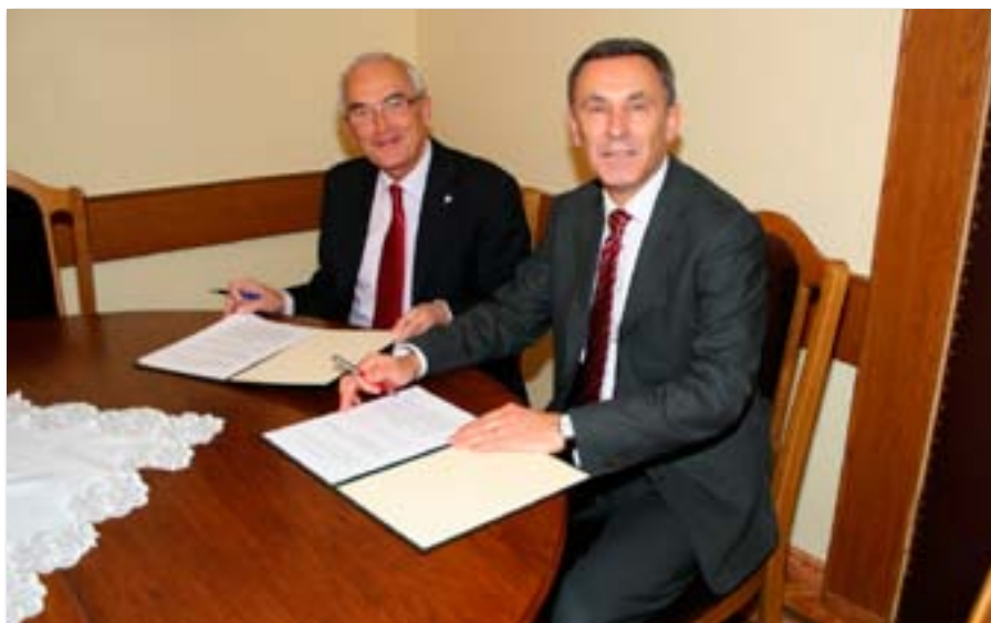
Podpisanie porozumienia o współpracy między UEP a Akademią Wychowania Fizycznego