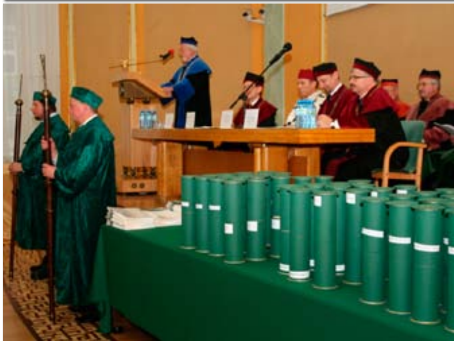
Uroczyste promocje doktorów i doktorów habilitowanych na UEP w roku akademickim 2010/2011