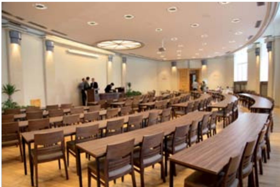
Mała aula UEP, wyremontowana przez PENTA INVESTMENTS, właściciela firmy Żabka Polska S.A.