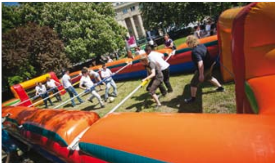
Dzień Sportu na UEP

Godne odnotowania są także sukcesy reprezentantów UEP w Akademickich Mistrzostwach Polski. W klasyfikacji uczelni społeczno-przyrodniczych studenci naszej Uczelni zajęli następujące lokaty: I miejsce w konkurencji bry-