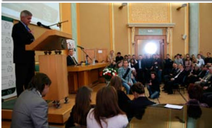
Wykład prof. Marka Belki w ramach III DNI UEP