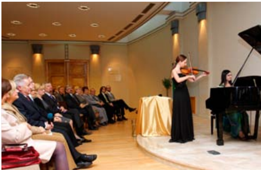
Koncerty z cyklu „Uczmy się kochać skrzypce”

Rektora z pracownikami wszystkich katedr Uczelni.