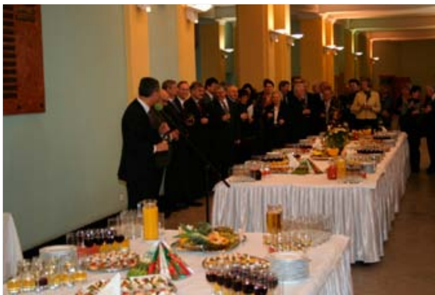
Spotkanie gwiazdkowe władz z pracownikami Uczelni

Poza usprawnieniem komunikacji wewnętrznej Uczelnia przywiązuje również ogromną wagę do współpracy z interesariuszami zewnętrznymi. W roku sprawozdawczym władze Uczelni wypracowały klarowne zasady kształtowania i koordynacji relacji z otoczeniem, zwiększyły liczbę i skuteczność kontaktów z praktyką gospodarczą, uczelniami, szkołami średnimi, mediami, absolwentami, władzami lokalnymi