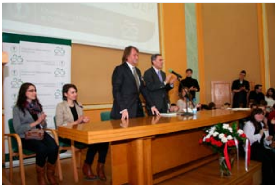
Spotkanie z dr. Janem Kulczykiem pod hasłem „I had a dream – and I still do” w ramach obchodów III DNI UEP

Obchody roku jubileuszowego 85-lecia Uczelni zbiegły się ze 125-leciem działalności Stowarzyszeń Architektonicznych w Wielkopolsce i ze zorganizowanym z tej okazji na Uczelni seminarium z udziałem elity architektów polskich. Zwieńczenie uroczystości stano-