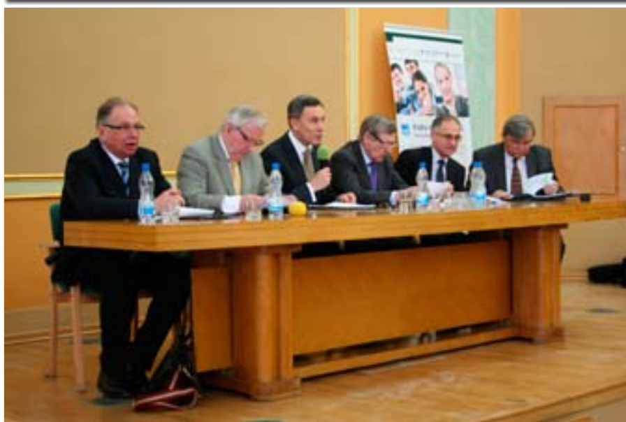
Uczestnicy panelu pt. „Implikacje kryzysu dla ekonomii i gospodarki” w ramach III DNI UEP

wiło odsłonięcie na frontonie budynku głównego pamiątkowej tablicy poświęconej Adamowi Ballenstaedtowi, projektantowi tego gmachu.