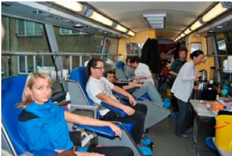
Akcja honorowego krwiodawstwa „WAMPIRIADA”

W okresie objętym sprawozdaniem dofinansowanie działalności socjalno-