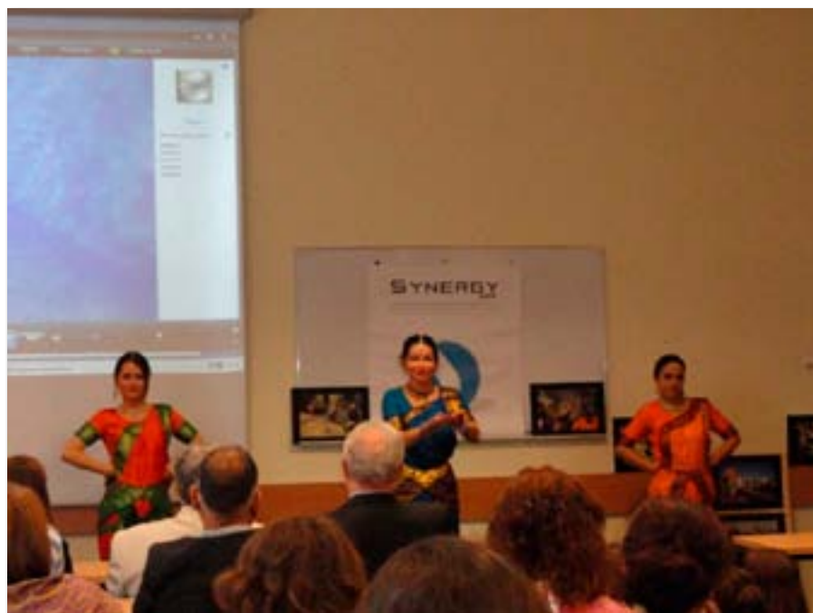
Konferencja międzynarodowa pt. „Chak de! India. Aspire today, inspire tomorrow” – w ramach organizowanych na UEP DNI INDII