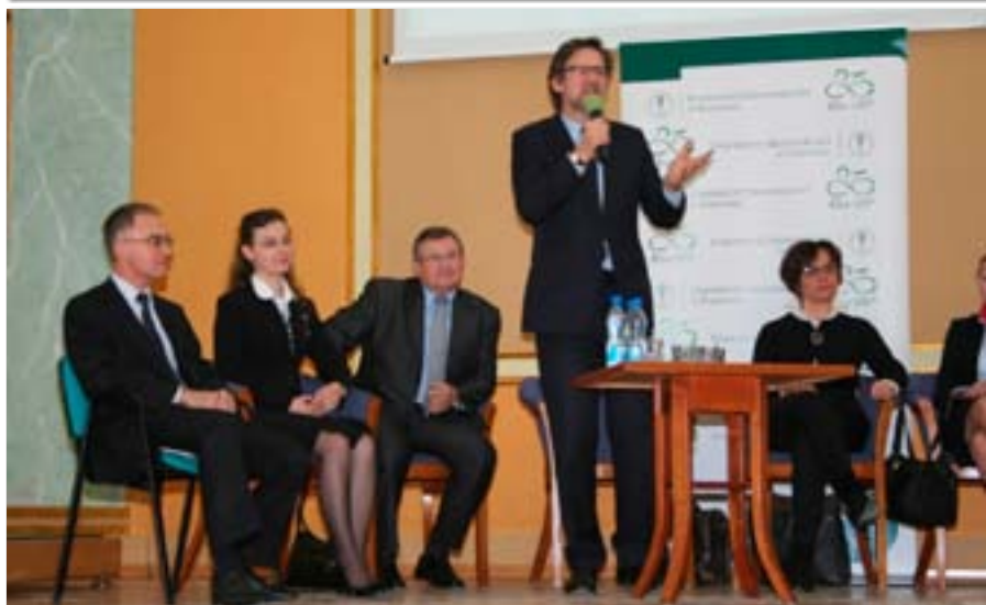
Spotkanie z wybitnymi absolwentami Uczelni podczas III Dni UEP