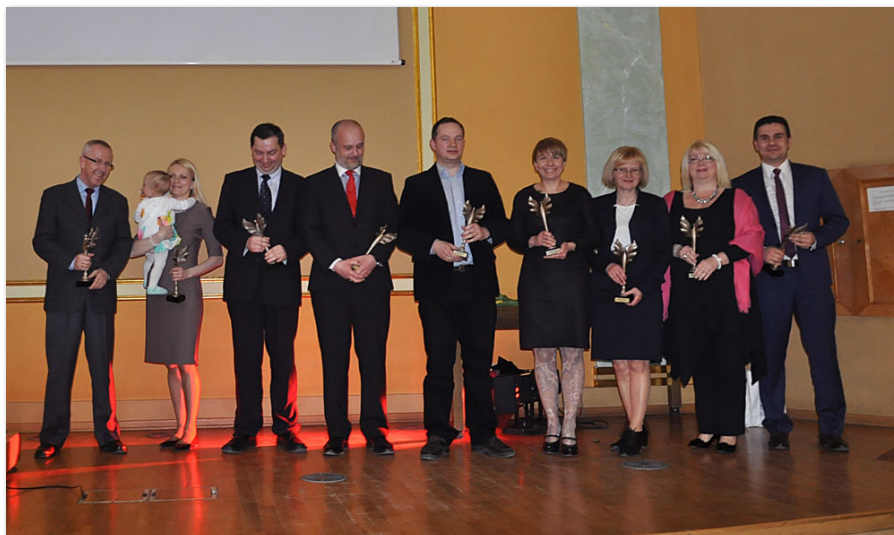
Laureaci konkursu VICTORIE 2014

Pięcioro absolwentów UEP znalazło się wśród laureatów VI edycji Konkursu o Nagrodę Prezesa Narodowego Banku Polskiego na najlepszą pracę magisterską z zakresu nauk ekonomicznych w 2013 roku: