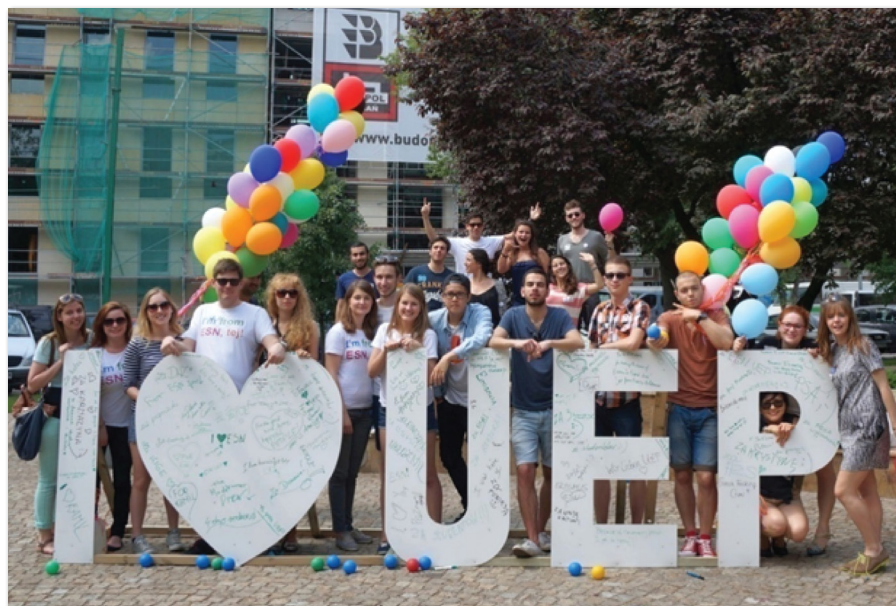
International Day „Taste the World”

Organizacja studencka ESN UE Poznań, która działa na Uniwersytecie Ekonomicznym od października 2007