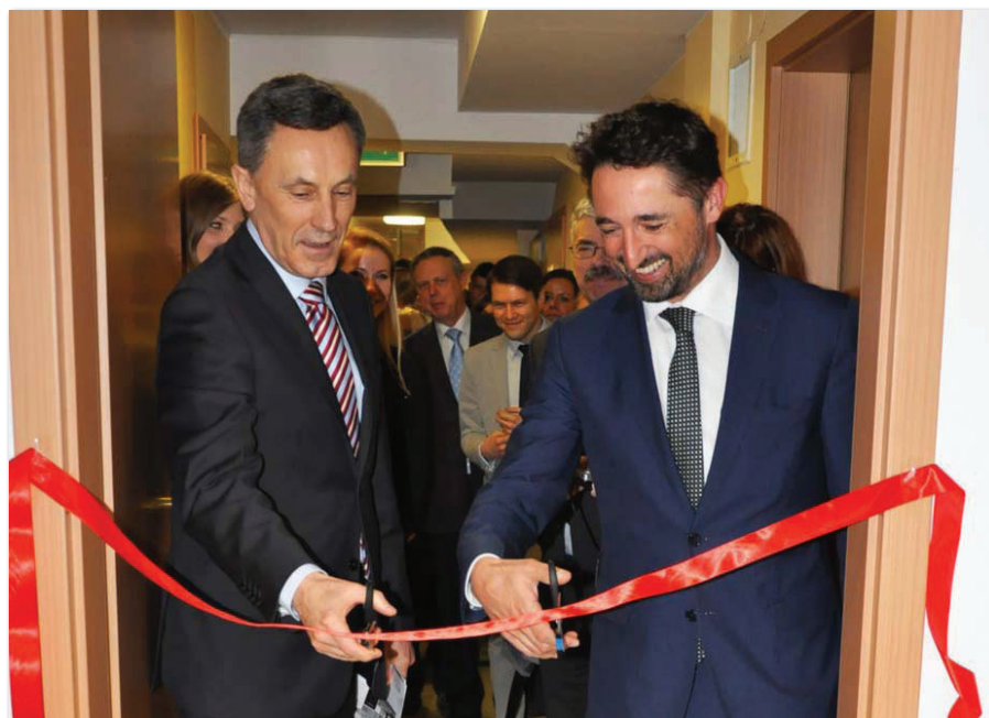
Otwarcie Laboratorium Tradingowego

Dzięki współpracy z praktykami biznesu w minionym roku akademickim wzbogacono ofertę dydaktyczną o nową specjalność. Na Wydziale Zarządzania na kierunku finanse i rachunkowość uruchomiono specjalność operacje finansowe funduszy inwestycyjnych . Kształcenie w tym kierunku odbywa się na studiach stacjonarnych II stopnia. Utworzenie specjalizacji było możliwe poprzez współpracę z firmą Franklin Templeton Investments zajmującą czołowe miejsce, jeśli chodzi o globalny rozwój oraz inwestycje papierów wartościowych i innowacyjne produkty. Przedsiębiorstwo oferuje alternatywne rozwiązania inwestycyjne pod markami Franklin, Templeton oraz Mutual Series w ponad 150 krajach na całym świecie, utrzymując w zarządzaniu aktywa o wartości ponad 815 miliardów dolarów (według stanu na 30 czerwca 2013 roku). W Poznaniu Oddział Franklin Templeton Investments Poland mieści się przy Placu Andersa 3, gdzie odbywają się wybrane zajęcia w ramach nowej specjalności. Studen-