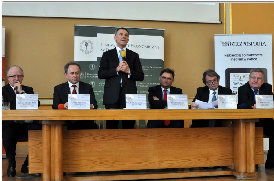
Panel dyskusyjny z udziałem zaproszonych gości podczas VI Dni UEP