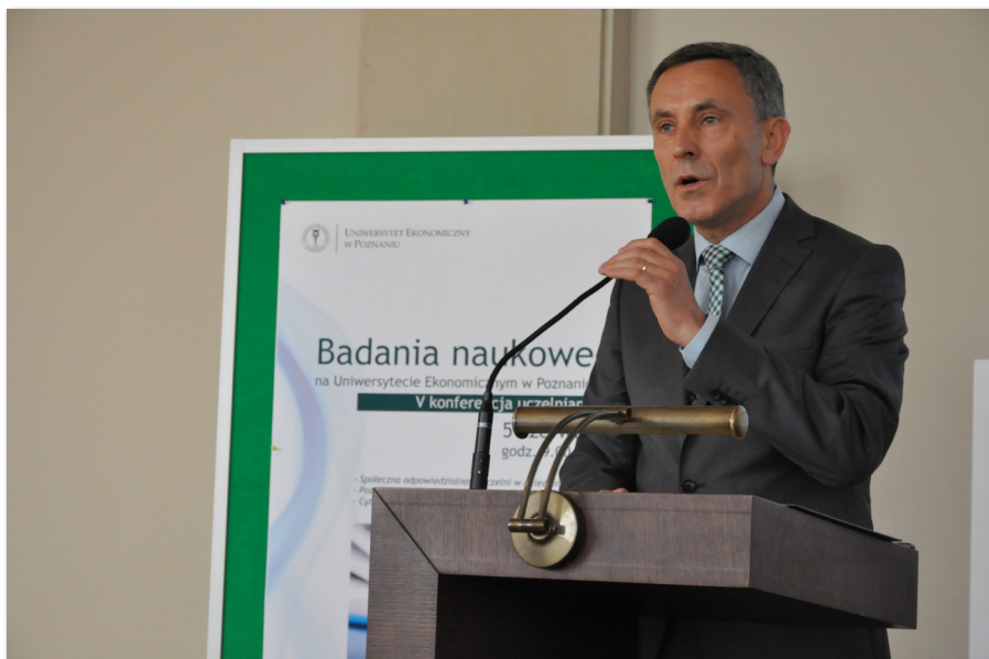
V Konferencja Uczelniana „Badania naukowe na Uniwersytecie Ekonomicznym w Poznaniu”