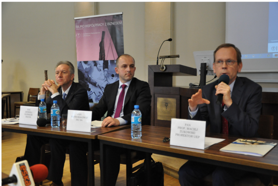
Debata pn. „Tylko ZUS czy ZUS i OFE?”