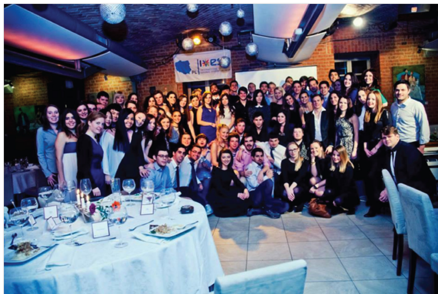
Gala pożegnania studentów Erasmusa połączona z ceremonią rozdania nagród Erasmus Awards

cy na celu ukazanie piękna Europy, zachęcenie do podróży oraz przede wszystkim wyłonienie najlepszych zdjęć przedstawiających Polskę oraz inne kraje europejskie,