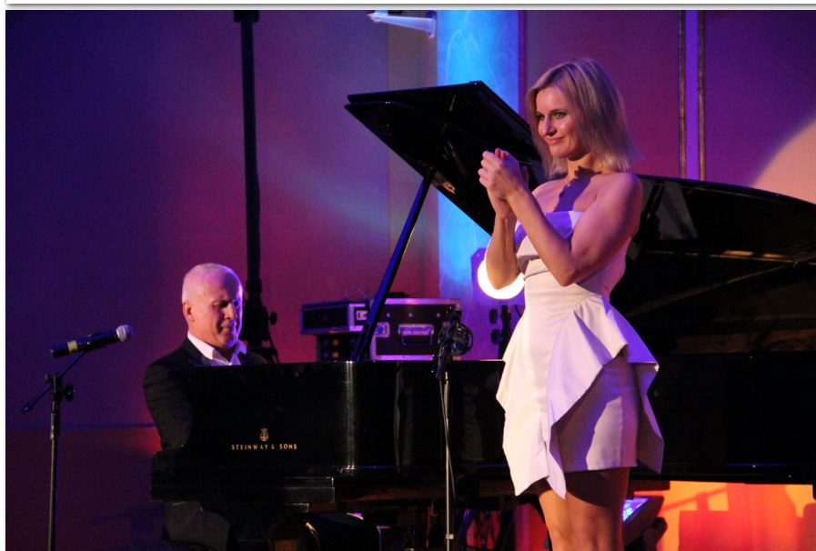
Gala VI Dni UEP