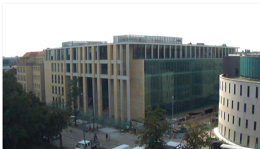
Budowa Centrum Edukacyjnego Usług Elektronicznych przy ul. Towarowej 55

nicznych (CEUE) przy ul. Towarowej 55. W okresie sprawozdawczym budowa gmachu weszła w decydujący etap – zakończono otwarty stan surowy oraz przeprowadzono prace instalatorskie i monterskie.