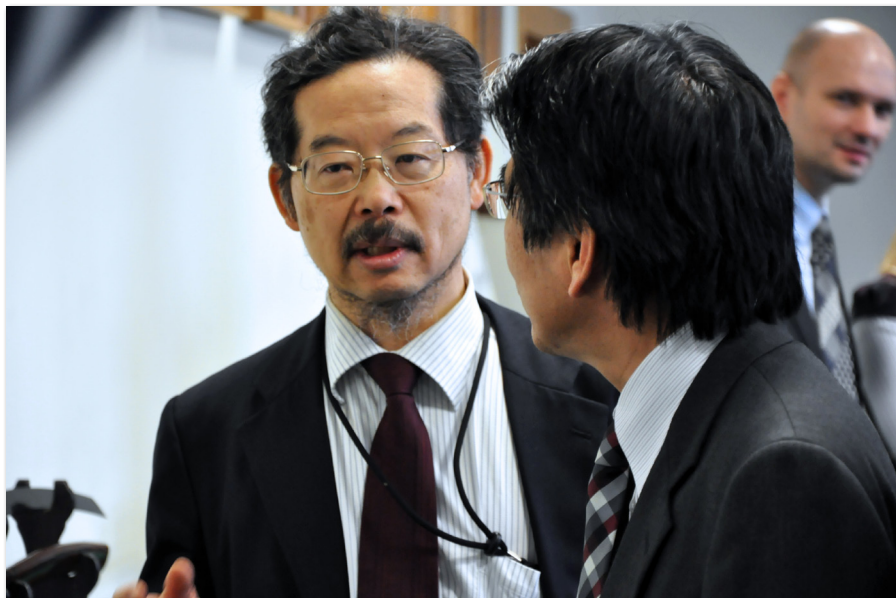
Dzień Japoński na UEP