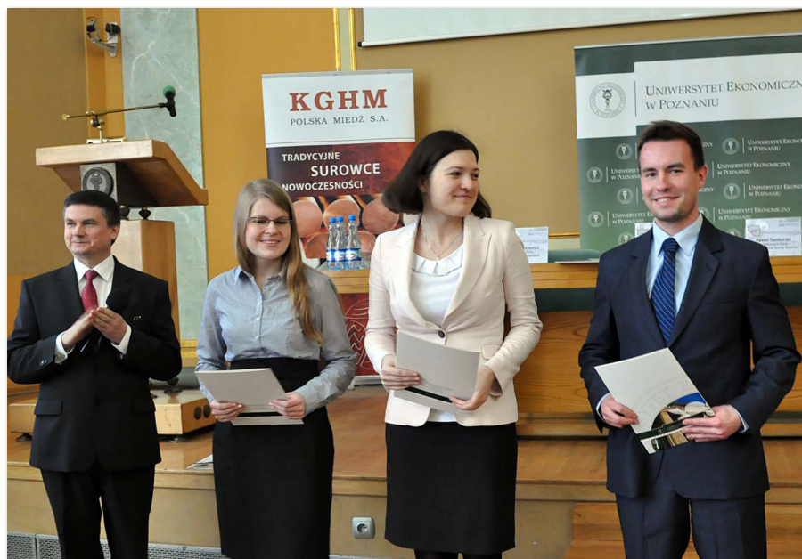
Wręczenie nagród Fundacji UEP laureatom konkursu na najlepsze prace licencjackie