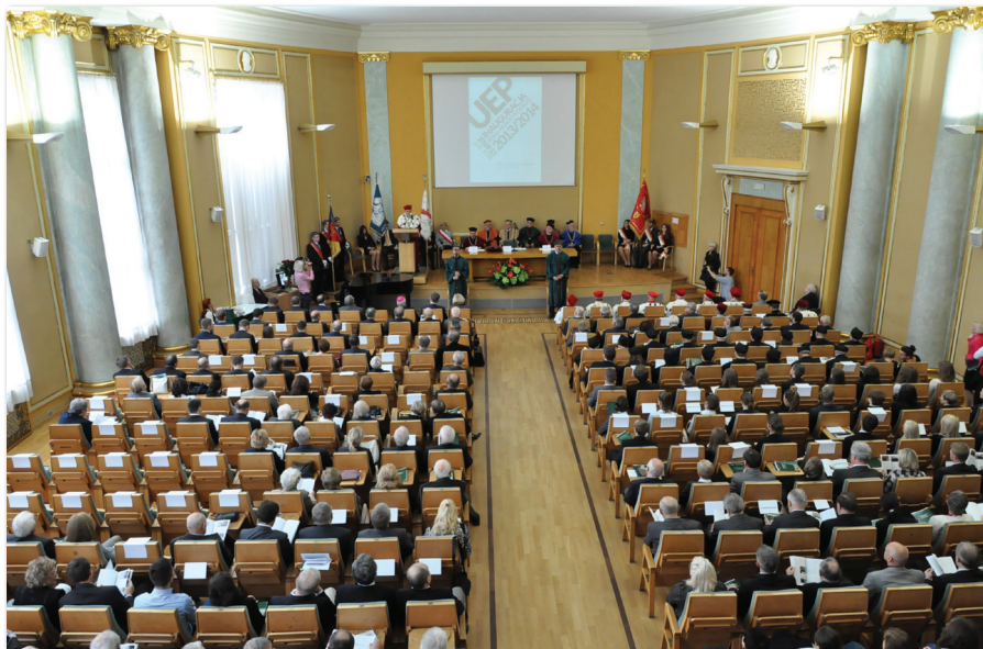
Inauguracja roku akademickiego UEP 2013/2014