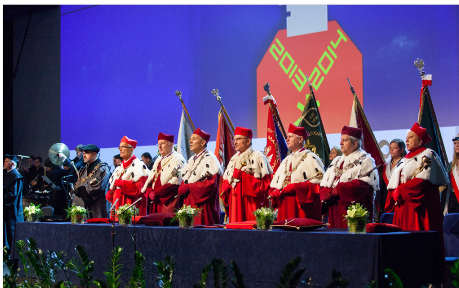
Poznańska Inauguracja Roku Akademickiego 2013/2014