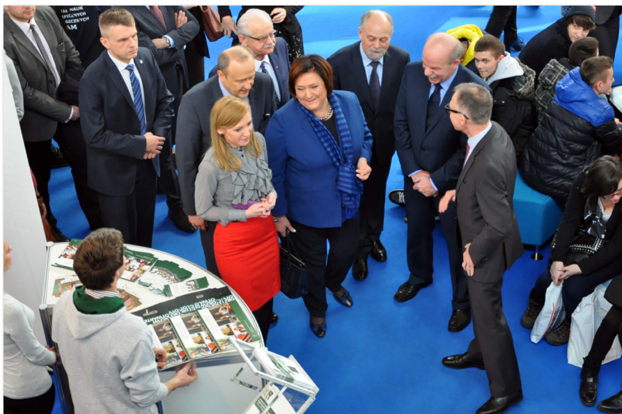
UEP na Targach Edukacyjnych w Poznaniu

Głównym zadaniem Klubu jest przede wszystkim poszerzenie oferty dydaktycznej o zajęcia z praktykami biznesu. W roku akademickim 2013/2014 zorganizowanych zostało 9 takich spotkań: