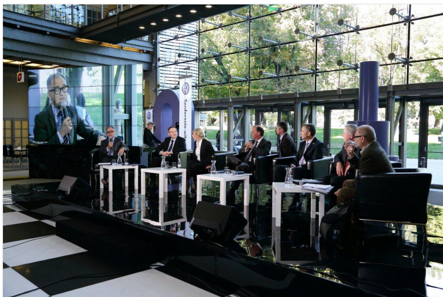
Debata „Ludzie. Przemysł. Miasto. Razem czy osobno?” zorganizowana w ramach obchodów jubileuszu 20-lecia firmy Volkswagen Poznań

W okresie sprawozdawczym Klub Partnera podjął także dodatkowe inicjatywy, takie jak: