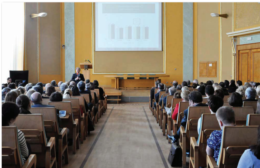
„Spotkanie strategiczne” władz Uczelni z pracownikami

nia Kadr za największe postępy w promocji kadr naukowych. W jubileuszowym 15. rankingu Perspektywy 2014 UEP przesunął się też o trzy pozycje w górę w zestawieniu ogólnym, w którym ocenie poddano 195 polskich uczelni. Wśród uczelni akademickich nasza Uczelnia zajęła wysokie 18. miejsce. Oceniając, brano pod uwagę sześć kategorii kryteriów: prestiż (w tym preferencje pracodawców i uznanie międzynarodowe), innowacyjność (w tym: patenty, zaplecze innowacyjne, pozyskane środki), potencjał naukowy (w tym nasycenie pracownikami o najwyższych kwalifikacjach, uprawnienia do nadawania stopni), efektywność naukową (w tym rozwój kadry, cytowania, publikacje), warunki studiowania oraz umiędzynarodowienie. Opublikowany ranking Perspektywy 2014 to dowód na coraz silniejszą pozycję UEP na akademickiej