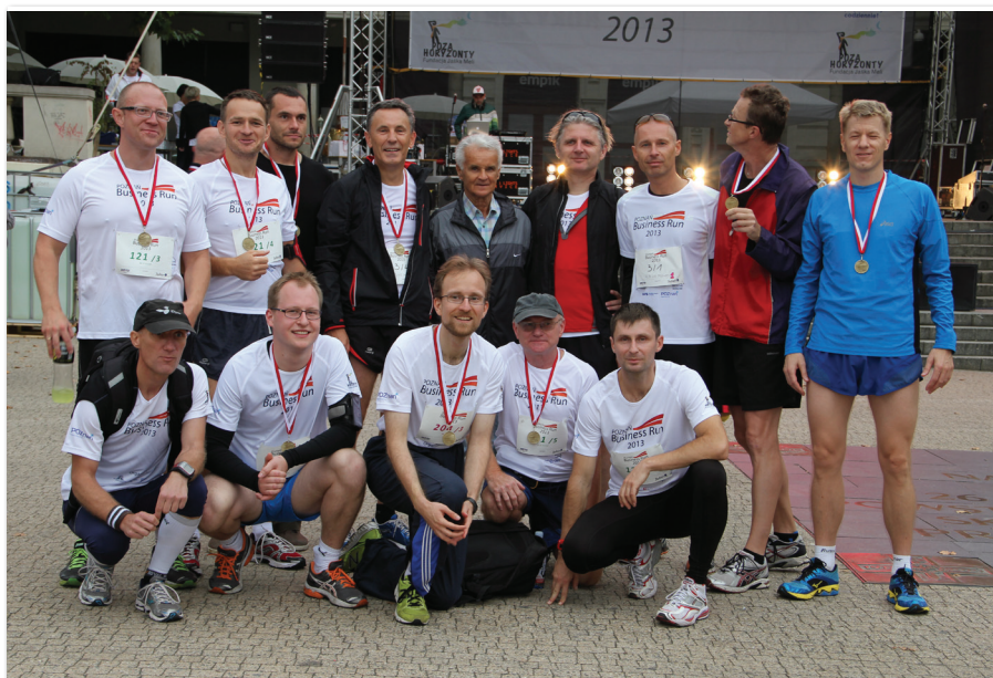
Drużyna UEP w biegu „Poznań Business Run”

Rok akademicki 2013/2014 był szczególnie pod względem organizacji zawodów oraz imprez sportowych i rekreacyjnych dla studentów, pracowników i absolwentów UEP. O zaangażowaniu pracowników SWFiS oraz studentów –