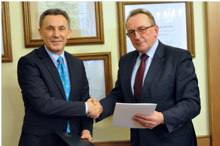
Podpisanie porozumienia o współpracy z Samorządem Województwa Wielkopolskiego

Tradycyjnie już w ostatnią sobotę karnawału, 1 marca 2014 roku, w auli Uczelni odbył się Bal Seledynowy – w tym roku w konwencji balu wiedeńskiego. Jest to wydarzenie o charakterze charytatywnym. W tegorocznej edycji zbiera-