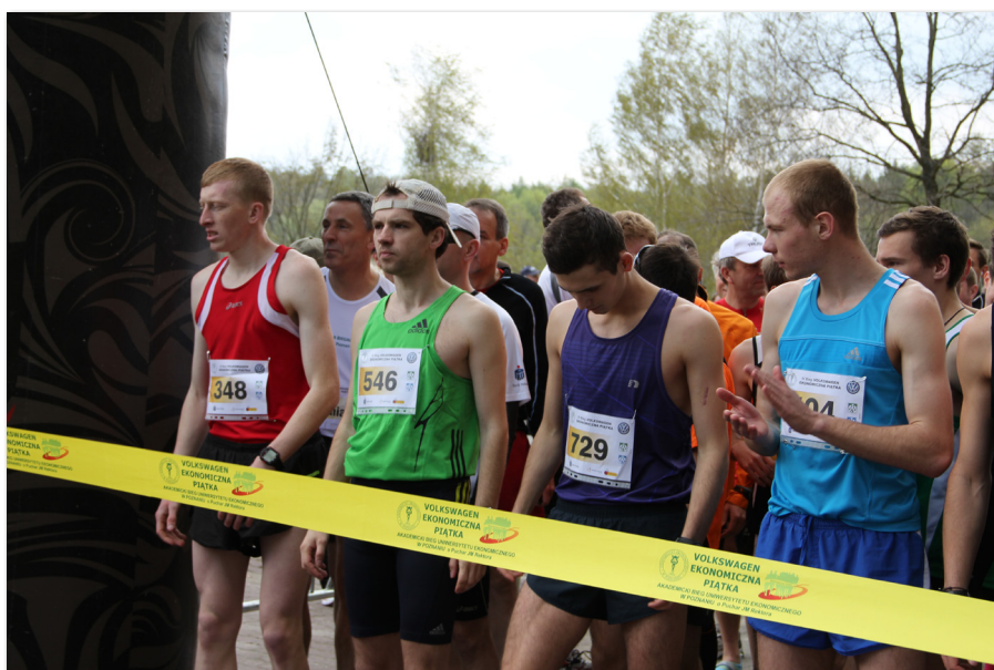
Uczestnicy biegu „Volkswagen Ekonomiczna Piątka”