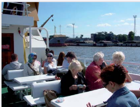
Rejs statkiem po Odrze w Szczecinie