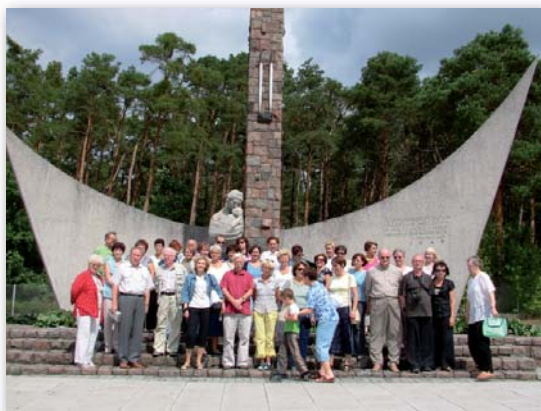
Pod pomnikiem w Siekierkach

Celem kolejnej wakacyjnej wycieczki organizowanej przez Komisję Uczelnianą było Pomorze Zachodnie. W dniach od 11 do 16 sierpnia 2008 r. uczestnicy wyjazdu zwiedzali m.in. Szczecin, Kamień Pomorski, Cedynię, Świnoujście i Międzyzdroje. Pogoda i humory dopisywały.